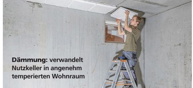
Dämmung: verwandelt Nutzkeller in angenehm temperierten Wohnraum